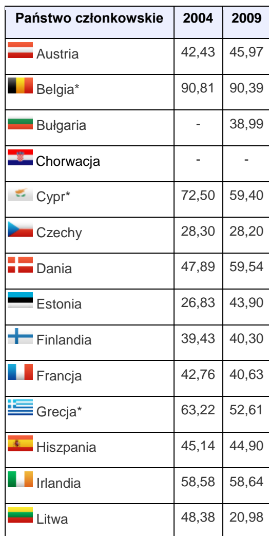
Tabela nr 3: Frekwencja w poszczególnych państwach członkowskich w wyborach do Parlamentu Europejskiego 2004 i 2009