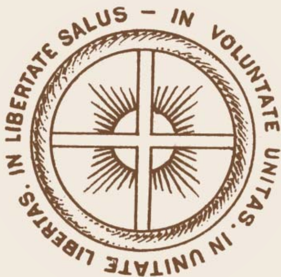
Biblioteka Narodowa w Warszawie

Taki sam symbol został przyjęty po I wojnie światowej przez Ruch Paneuropejski Coudenhove'a-Kalergiego.